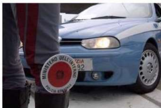
In alto l'intervento dei vigili del fuoco dopo l'incidente. La coppia viaggiava in moto quando è stata tamponata da un'auto in fuga. Indaga la polizia stradale di Varese